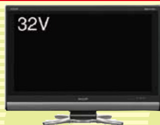
★シャープ液晶テレビ 32型