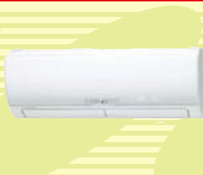
★三菱 お掃除省エネエアコン