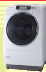
★東芝 ドラム式洗濯乾燥機