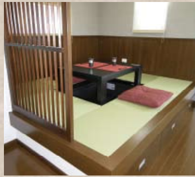
小上がリイメーシ [1F]

「和」のエッセンスを活かし、 落ち着きとくつろぎの空間をつくります。 充実した設備が嬉しい住宅です。